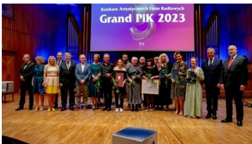
Fot. Laureaci i Fundatorzy KAFR „Grand PiK 2023”.

Konkurs ma też swoją odsłonę dla studentów kierunków dziennikarskich. W 2023 roku zorganizowano po raz 5-ty „Akademicki Grand PiK”. Studenci biorą udział w warsztatach podczas których prezentują przygotowane przez siebie utwory. Najlepsze prace oceniane są przez jurorów i nagradzane.