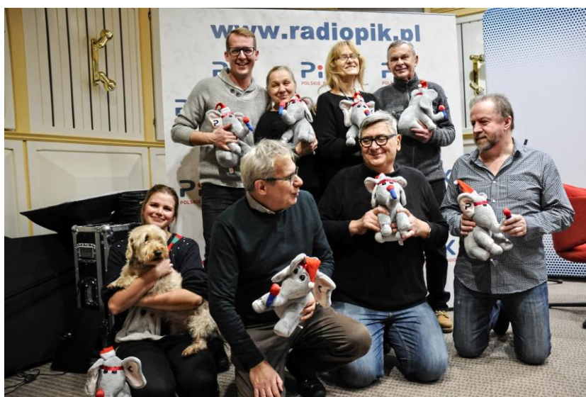
Fot. Aktorzy i reżyser „W Cichej Dolinie”, z archiwum PR PiK.

Umacnianiu pozycji rodziny poświęcona jest tematyka radionoweli „W Cichej Dolinie”. Jest to historia wielopokoleniowej rodziny Malinowskich z Cichej Doliny, małej miejscowości niedaleko Bydgoszczy. Słuchacze śledzą losy bohaterów, ich zmartwienia, troski i radości; wspólnie przeżywają też trudności życia codziennego.