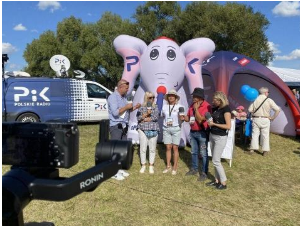
Fot. PR PiK podczas jednej z imprez plenerowych, z archiwum PR PiK.

Polskie Radio PiK uczestniczy we wszystkich ważnych wydarzeniach i imprezach kulturalnych, społecznych, sportowych, muzycznych, gospodarczych, religijnych, historycznych, proekologicznych w regionie. Wnioski o patronat organizatorzy składają online, poprzez formularz zamieszczony na portalu.