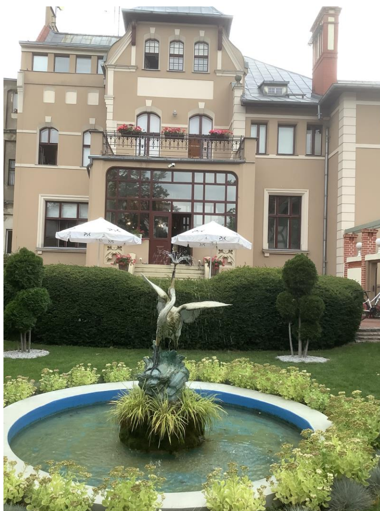
Fot. Willa H. Dietza ul. Gdańska 48 w Bydgoszczy, siedziba PR PiK, z archiwum PR PiK.

Akcje promocyjne, konkursy antenowe i kampanie reklamowe mają zachęcić do słuchania programów w technologii DAB+.